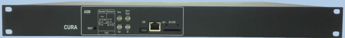
Vorderansicht des Gerätes